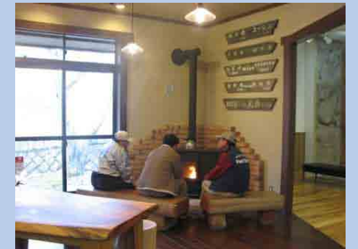
リニューアルされた西丹沢自然教室