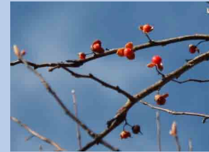
左:ツルリンドウ 右:ツルウメモドキ